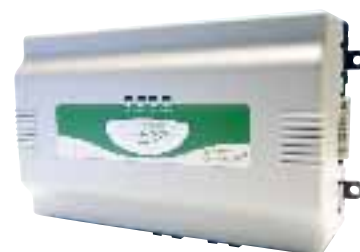
HAWK Integratie Module