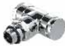
Verafix Design voetventiel haaks chroom