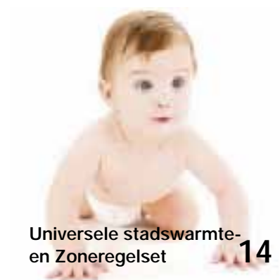
Universele stadswarmte- en Zoneregels