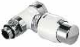
V2000 Design thermostatische radiatorafsluiter recht wit