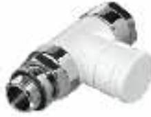
Verafix Design voetventiel recht wit