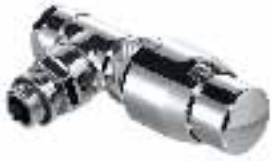
V2000 Design thermostatische radiatorafsluiter haaks chroom