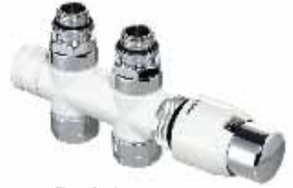
Thera Design H-blok vloeraansluiting wit