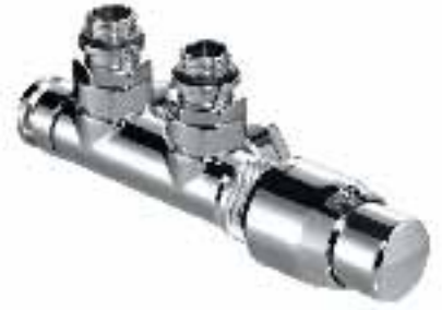
Thera Design H-blok muuraansluiting chroom